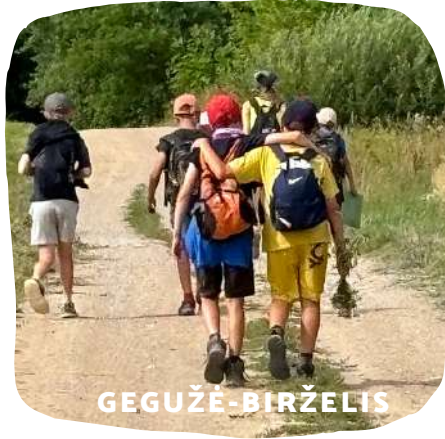
GEGUŽĖ - BIRŽELIS