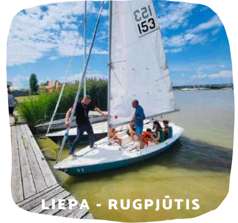
LIEPA - RUGPJŪTIS