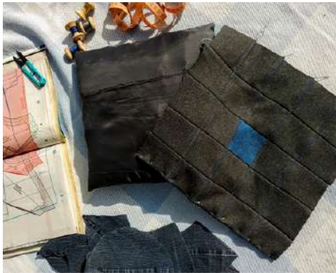
Pagalvėlė iš seno palto, panaudojant visas dalis (apvalkalas iš viršaus, pamušalas, kamšalas)