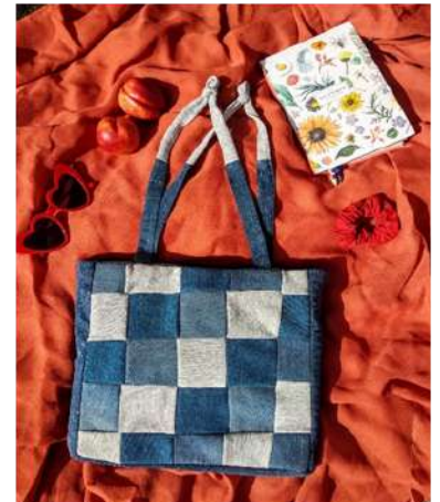
Krepšys iš senų džinsų ir sportinio treningo

2022 m. rudenį UAB „RETEXION“ pasirašė bendradarbiavimo sutartį su Žirmūnų profesinio mokymo centru , o viena praktikantė sukūrė savo tvarų prekinį ženklą DAMU .