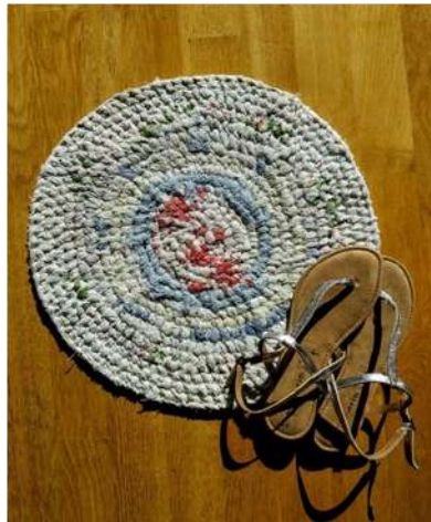
Iš senų virtuvės rankšluosčių supintas namų kilimėlis